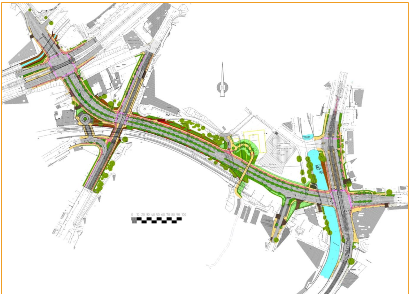
Lageplan Innerer Stadtring